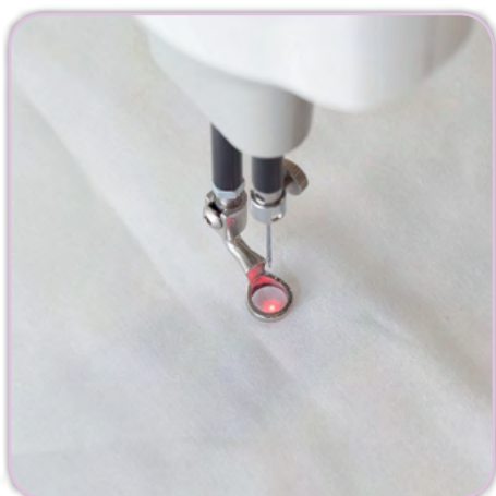
Point laser dans la zone de l'aiguille

Tension™) rendent le quilting simple et facile! Mais c'est loin d'être tout ce que peut offrir cette machine à quilting Infinity 26 HQ. Le coupe-fil automatique, le dispositif casse-fil, la commande numérique du volant manuel ou les micropoignées Comfort-Fit™ intégrées sont des composants pratiques qui facilitent considérablement le processus de quilting. Vous êtes adepte du quilting, alors l'Infinity 26 HQ est exactement ce qu'il vous faut! Outre la grande surface de travail et les caractéristiques-clés déjà nommées, la diversité de lumière unique est à souligner. Pour les travaux de quilting justement - peu