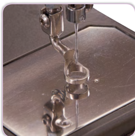
Pied sauteur robuste