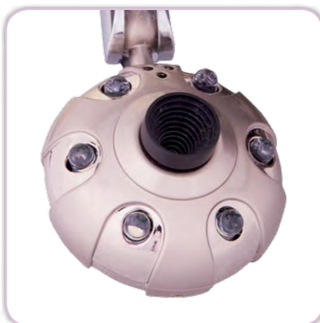
Caméra intégrée dans la zone de couture