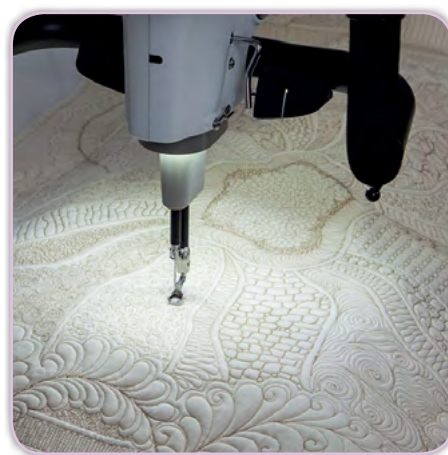
Lumière à DEL supplémentaire pour éclairer la zone de couture