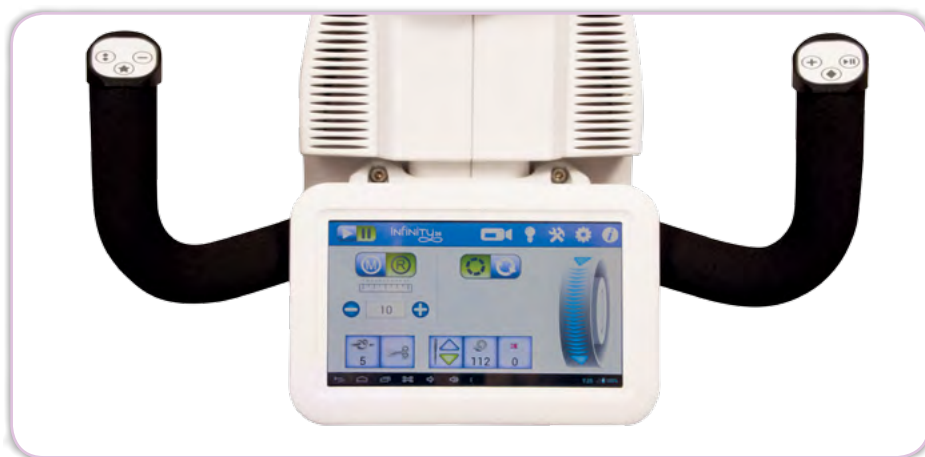
Élément de commande sur la tête de machine arrière, Manipulation simple grâce aux boutons dans les poignées