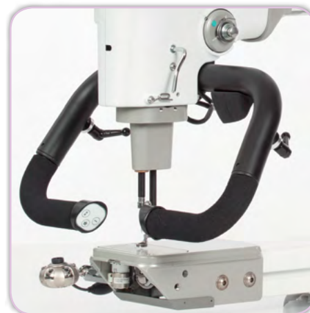
Micropoignées Comfort-Fit™ intégrées