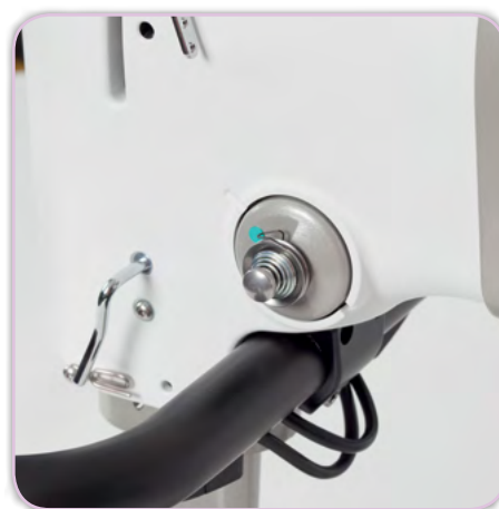
Réglage numérique de tension du fil, breveté, par écran tactile