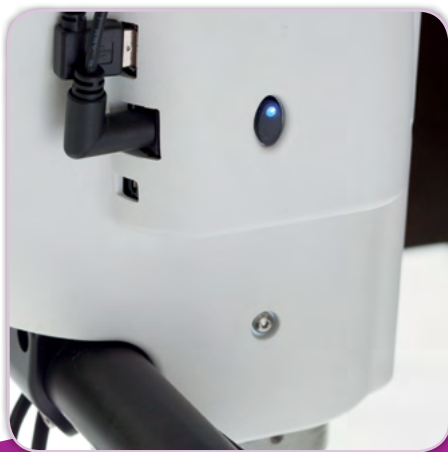
Interrupteur électrique sur la tête de la machine