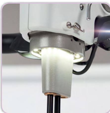
Anneau de lumière à DEL dans la zone de l'aiguille