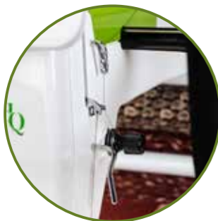
tension de fil manuelle